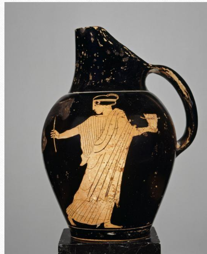
Œnochoé à figures rouges - Ulysse et Circé