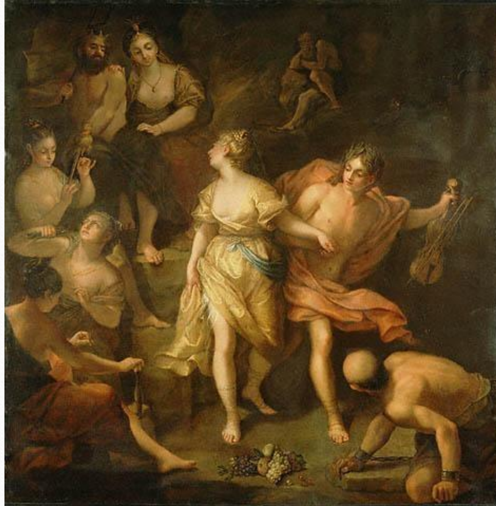
Jean Raoux Orphée et Eurydice

Vers 1718-1720 - Paul Getty Museum, Los Angeles