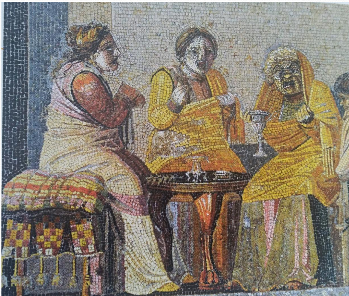
Deux femmes consultent une sorcière

Mosaïque de Dioscoride de Samos, Villa de Cicéron, I er siècle ap. J.-C.