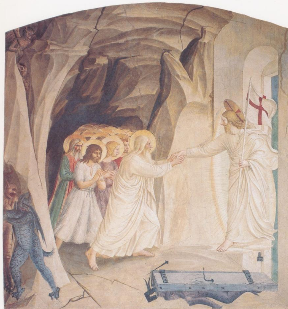
Fra Angelico La descente aux Enfers XV ème siècle - Couvent San Marco, Florence