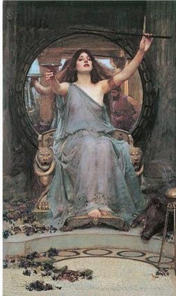
John William Waterhouse - Circé offrant la coupe à Ulysse