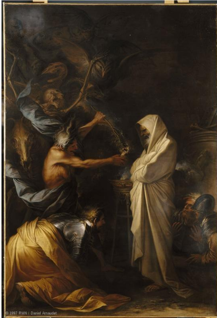
Salvator Rosa, L'ombre de Samuel apparaissant à Saül chez la Pythonisse d'Endor 1668 – Musée du Louvre