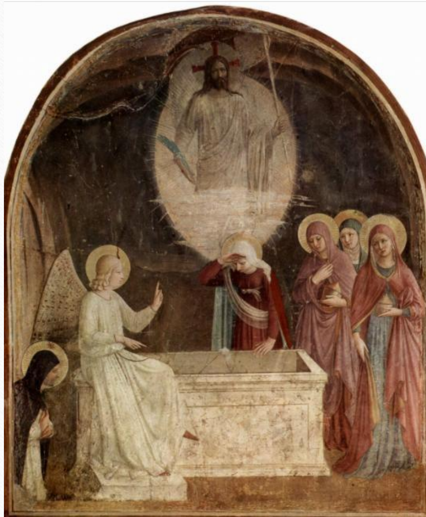
Fra Angelico Les Saintes Femmes au tombeau XV ème siècle - Couvent San Marco, Florence