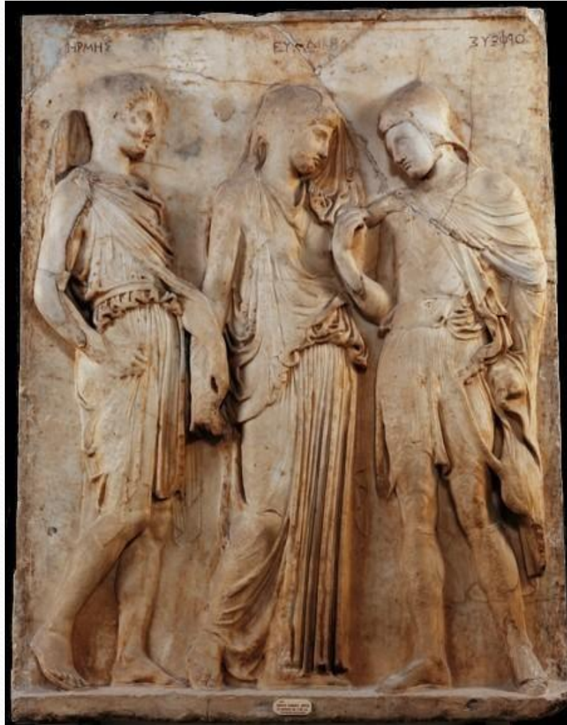
Orphée et Eurydice - Bas relief du I er ou II ème s ap. J.-C. Copie d'un original grec - Musée archéologique de Naples