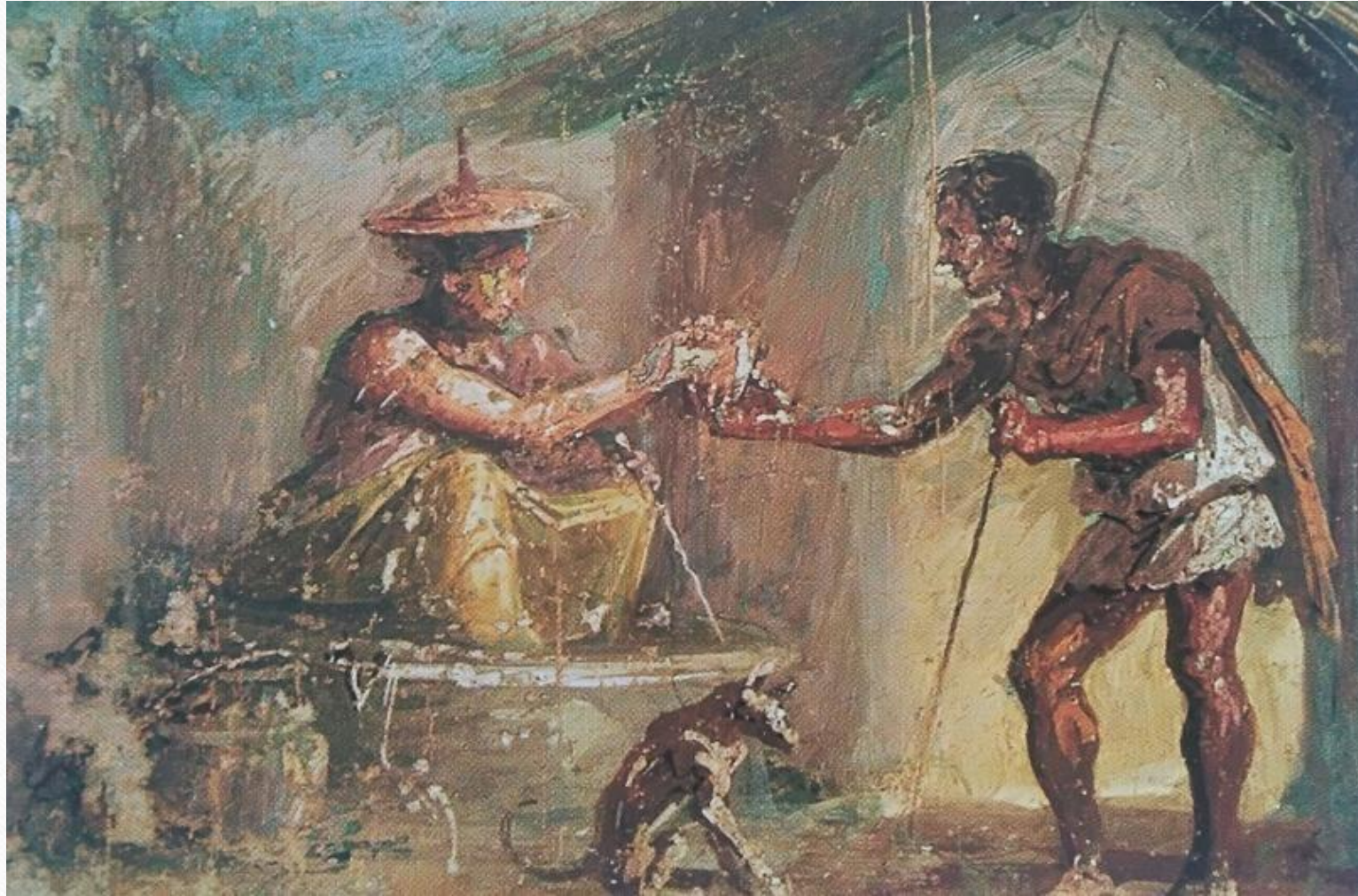
Voyageur consultant une sorcière Fresque de Pompéi - I er siècle ap. J.-C. Musée archéologique de Naples

Retrouver cette fresque avec une bibliographie sur le site suivant https://www.arretetonchar.fr/sequence-latin-3e-mages-sorcières-et-astrologues/