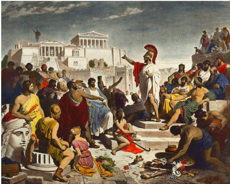
« Périclès prononçant l'oraison funèbre », Philippe Foltz, 1852

Journée d'étude co-organisée par le Département de Langues et littératures grecques et latines de l'Université Paris Nanterre et les IPR de Lettres Classiques des deux Académies de Versailles et de Paris