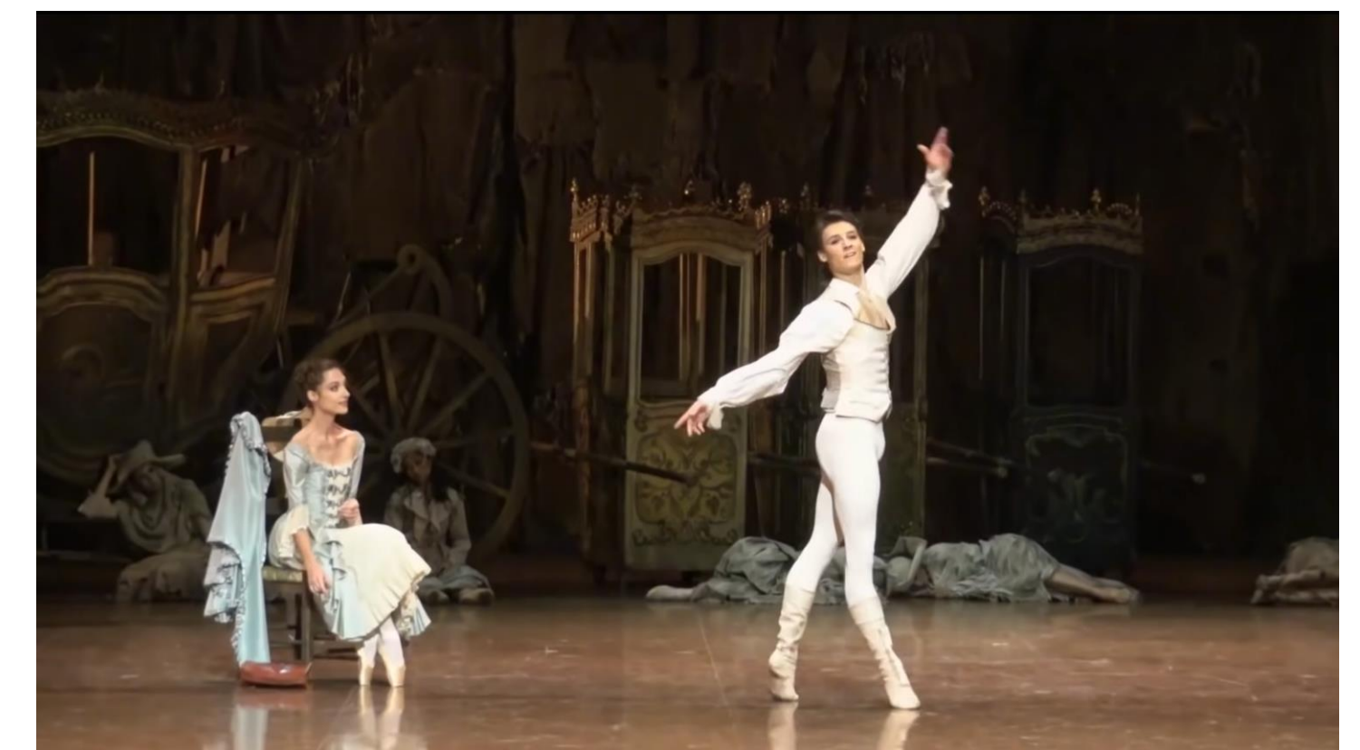
Le coup de foudre dans L’Histoire de Manon de Kenneth MacMillan