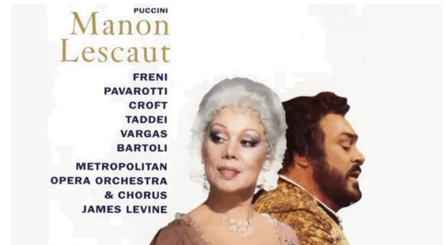
Le duo de l’amour dans Manon Lescaut de Giacomo Puccini, France Musique