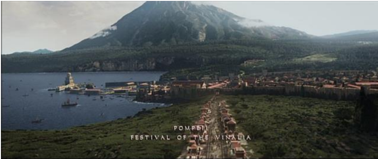
Incrustation donnant la date de l'action sur le plan d'ensemble de Pompéi.