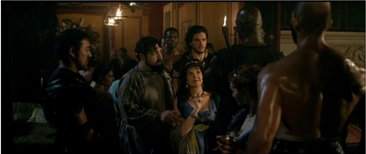
Les matrones s'encanaillent.