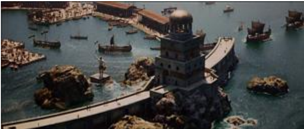
Digue, phare, quais, horrea.