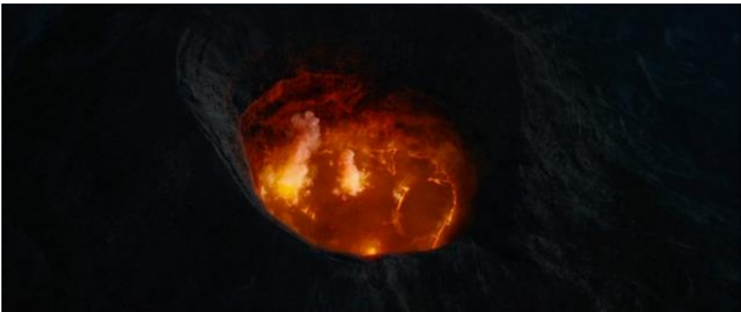
Impossible vue du cratère en fusion, étant donné que le volcan possède un bouchon rocheux avant l'éruption.