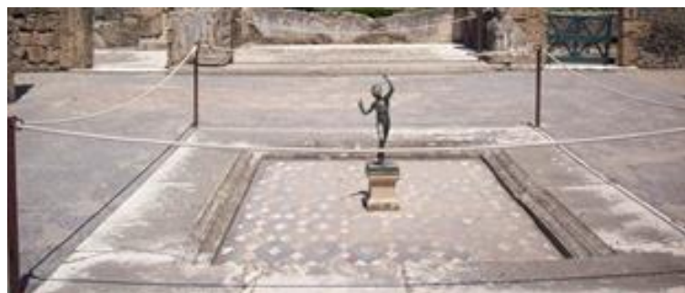
Impluvium de la maison du Faune.