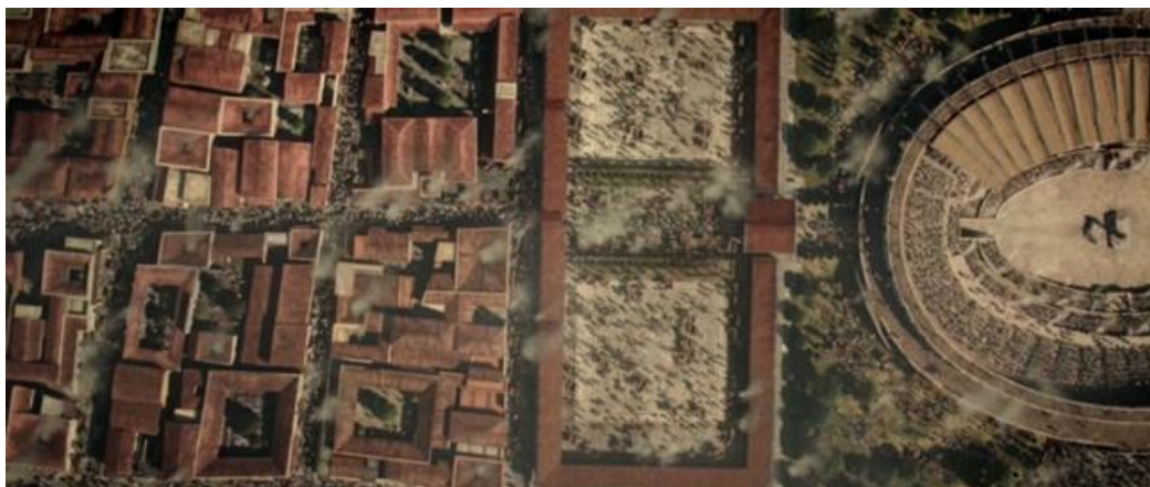
Reconstitution 3D à partir de vues aériennes : la palestre et l'amphithéâtre.