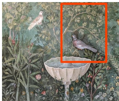
Fresque aux oiseaux, maison du bracelet d'or