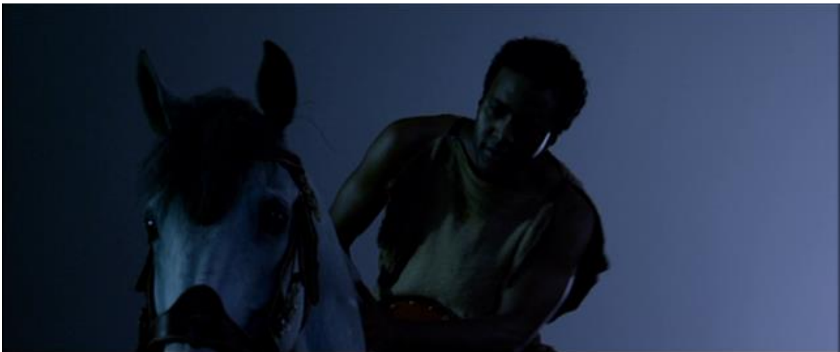
Un esclave bien libre de ses allées et venues.