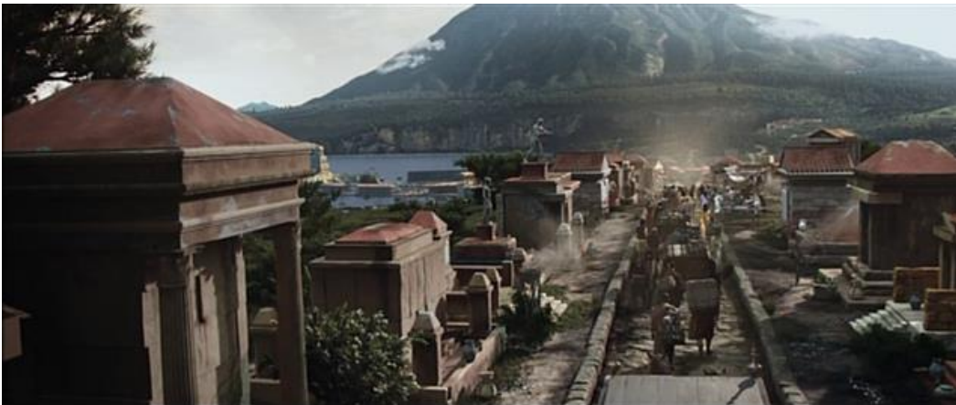
L'entrée de Pompéi, par le Sud, bizarre quand on vient de Rome !