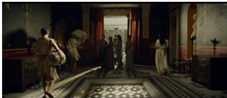
Impluvium de la villa de Severus