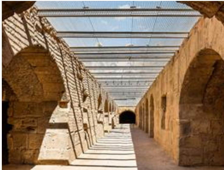
Galerie souterraine, El Jem