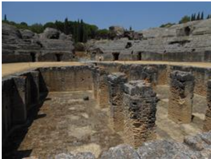
Fosse centrale, Italica