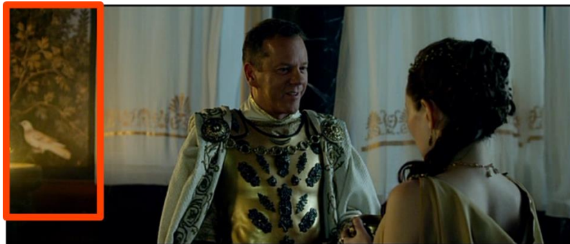
Intérieur de la villa de Severus