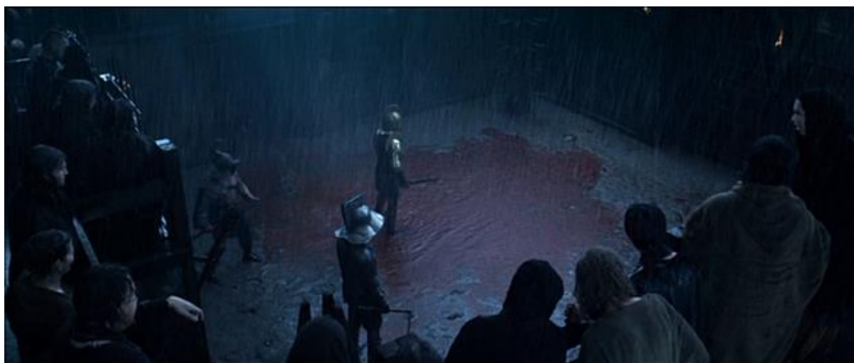
Double cliché : Londinium sous la pluie, gladiateurs prêts au massacre