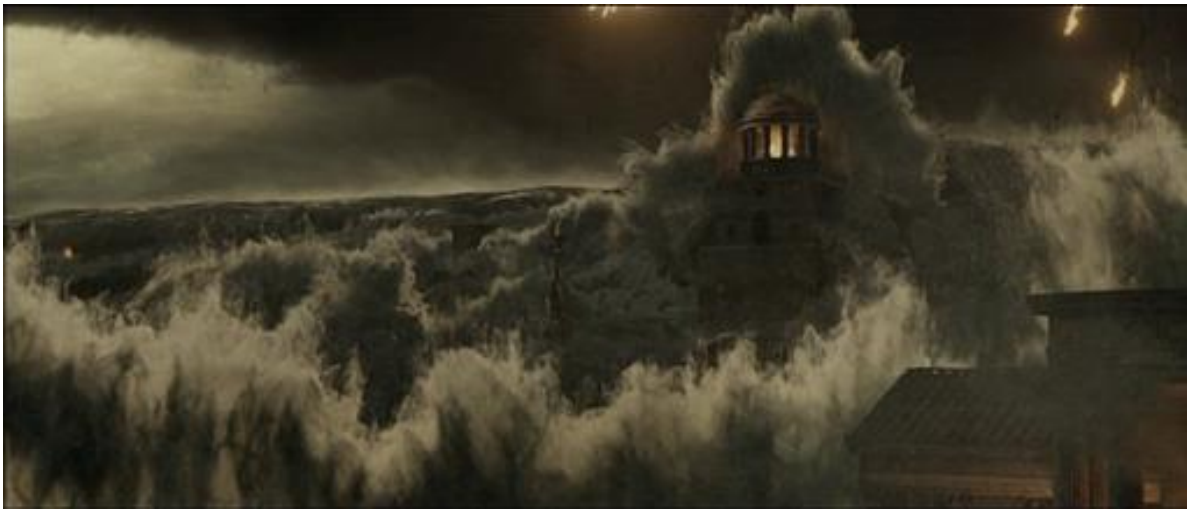
Le péplum vire au film catastrophe : le port englouti sous un tsunami