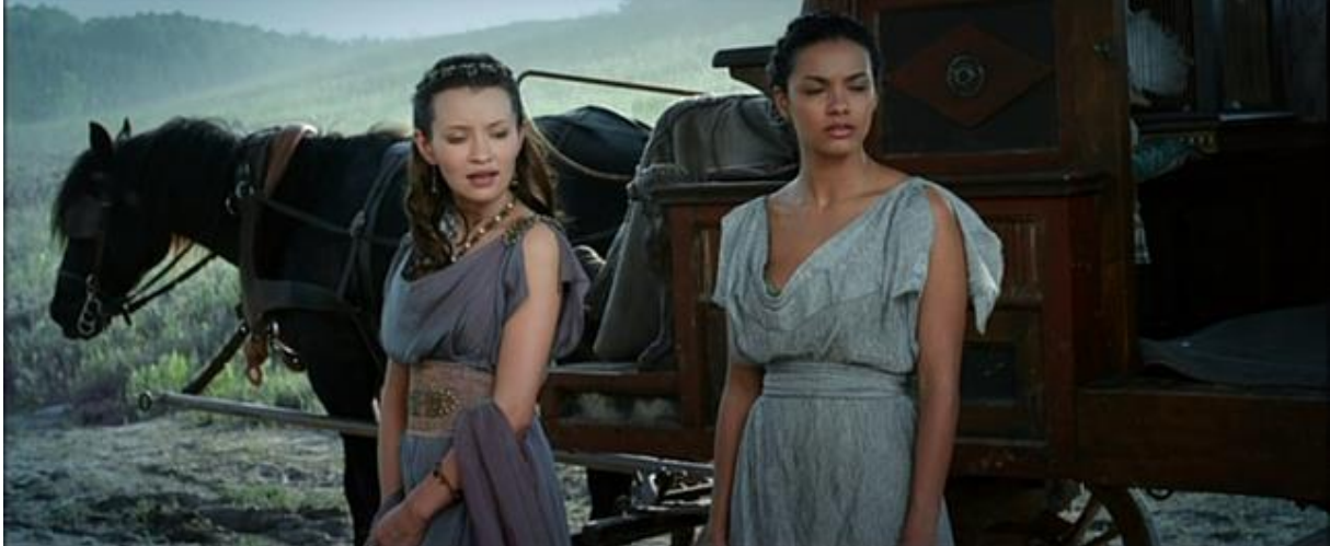
Des tenues problématiques pour ces jeunes pompéiennes livrées à elles-mêmes.