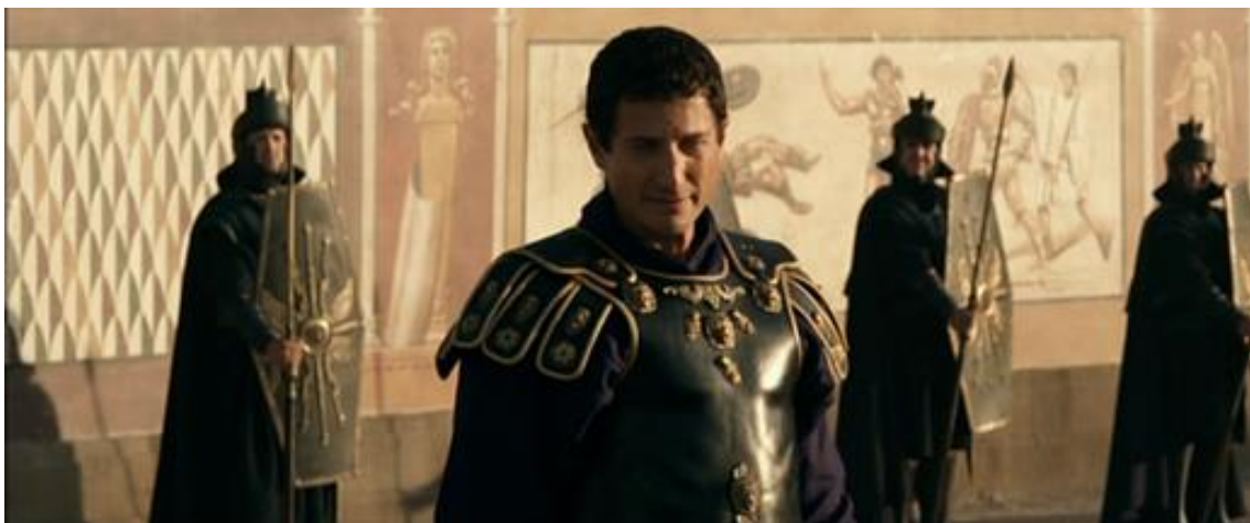
Les Romains, succédanés antiques des Nazis.