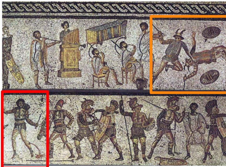
Mosaïques de Zliten, musée de Tripoli.