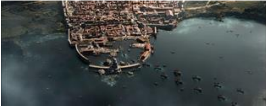
Le port de Pompéi reconstitué.