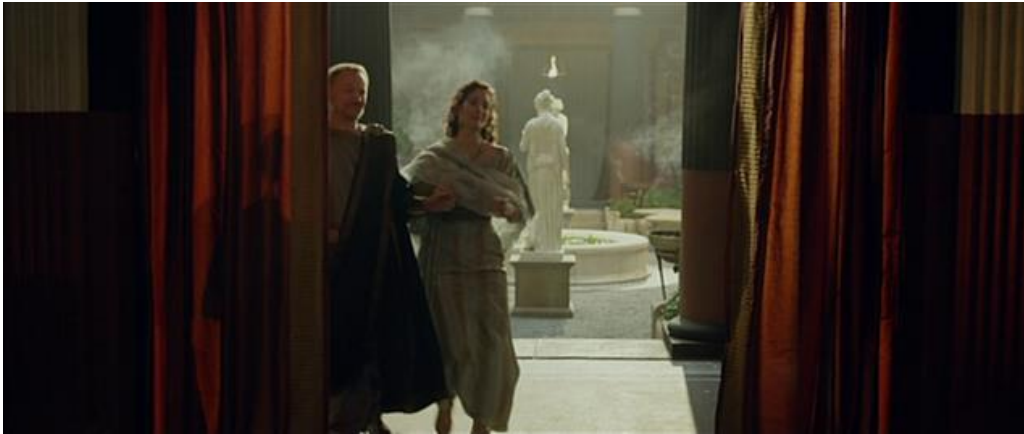
Première vue de la maison des Cassii, les statues restent blanches.