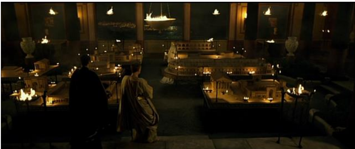
Projets d'infrastructures de prestige pour la cité de Pompéi.