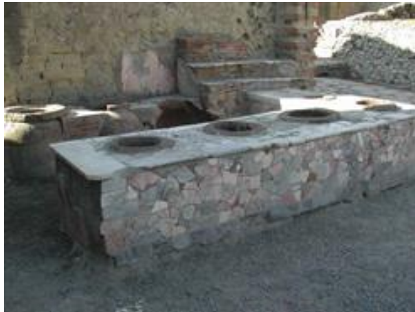
Thermopolium de Pompéi, Aldo Ardeti, CC, wikimedia commons.