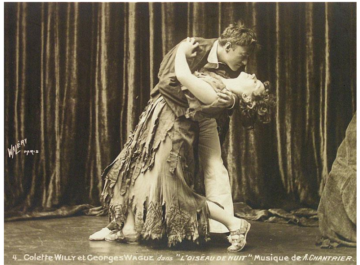
Figure 7 - Colette et Georges Wague dans « L'Oiseau de nuit » (1911)