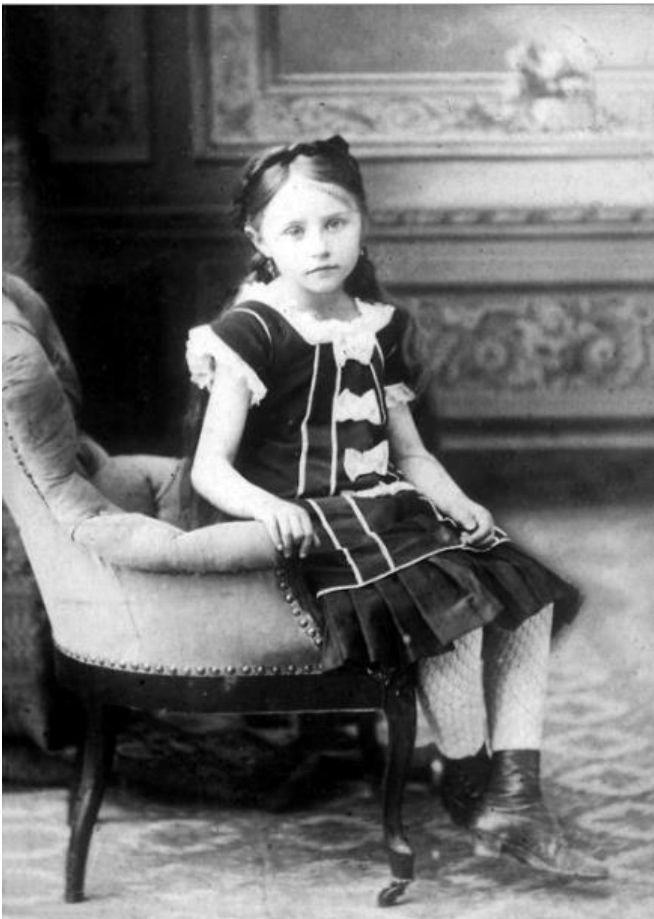
Figure 14 - Colette à cinq ans, à Saint-Sauveur-en-Puisaye