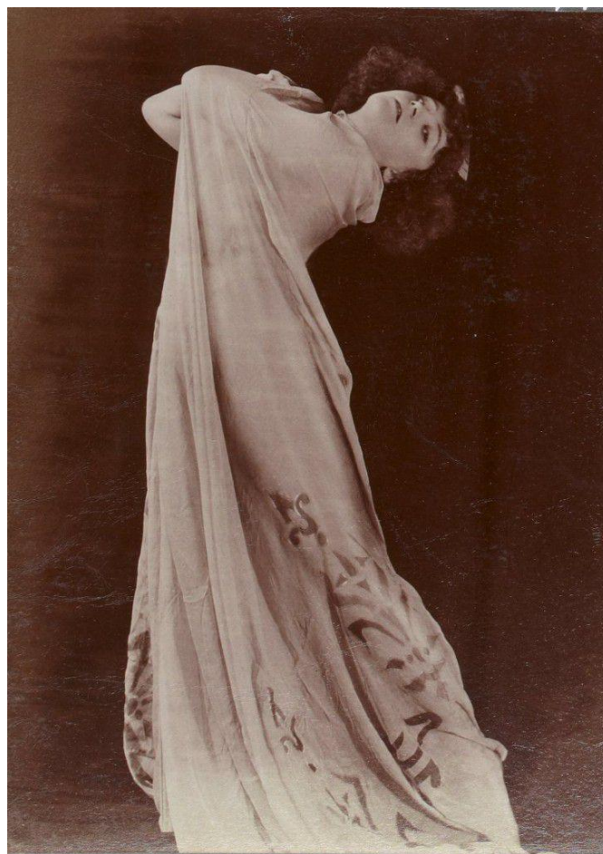
Figure 5 - Colette dans « Rêve d'Égypte » (1907)