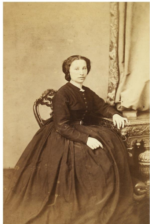
Figure 3 - Sido, mère de Colette (1857)