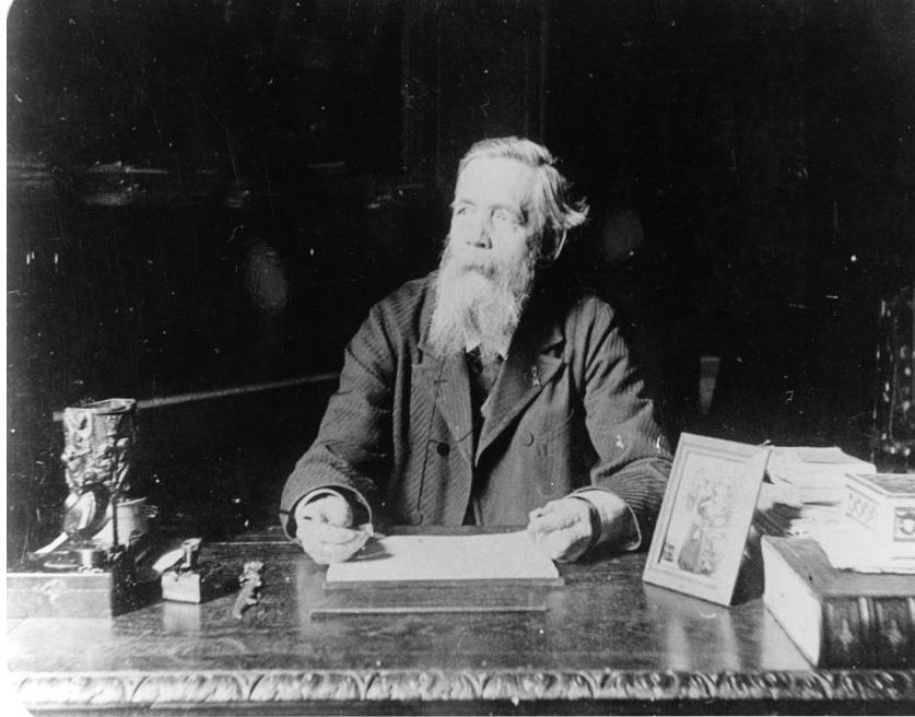
Figure 1 - Le capitaine Colette, père de Colette, à son bureau (1900)