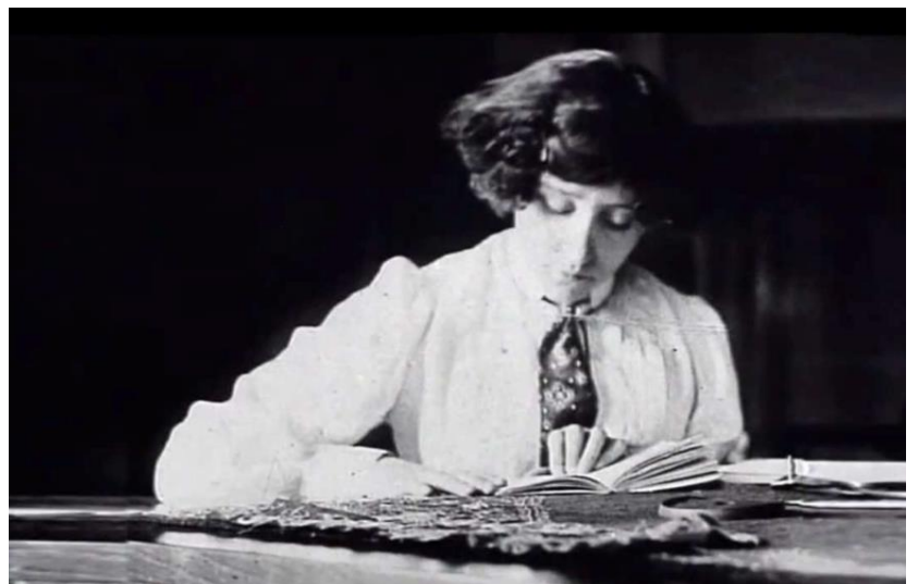
Figure 11 - Colette au travail, rue de Courcelles (vers1900)