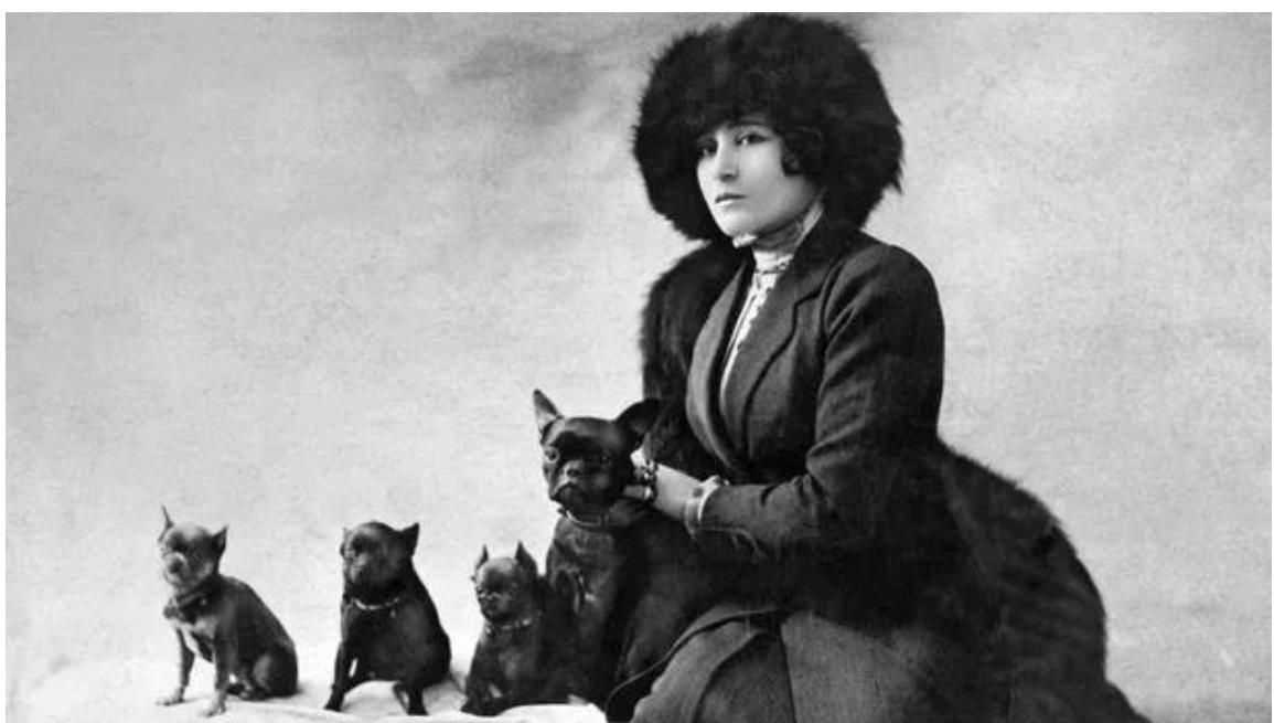
Figure 16- Colette avec ses chiens en 1907