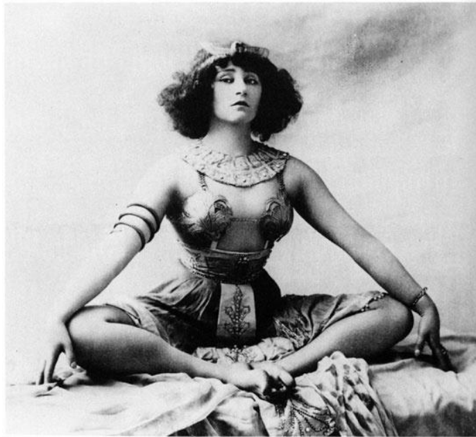
Figure 6 - Colette dans la pantomime « Rêve d'Égypte » au Moulin-Rouge (1907) photographiée par Léopold-Émile Reutlinger.