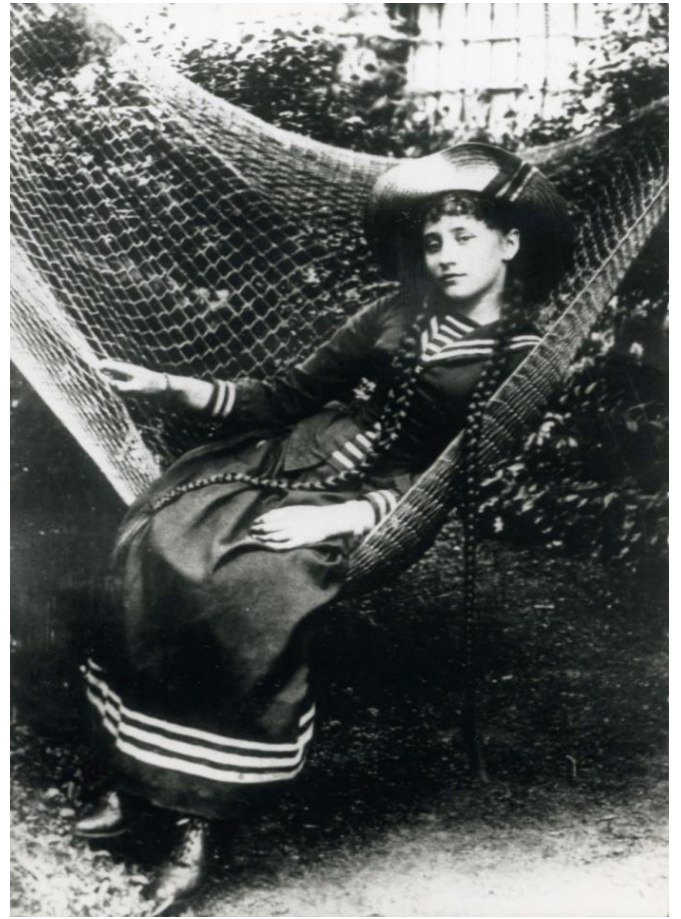
Figure 13 - Colette, jeune fille, à Sant-Sauveur-en-Puisaye