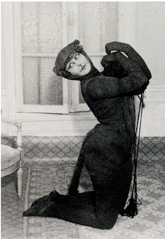
Figure 8 - Colette dans la pantomime « La Chatte amoureuse » (1912)