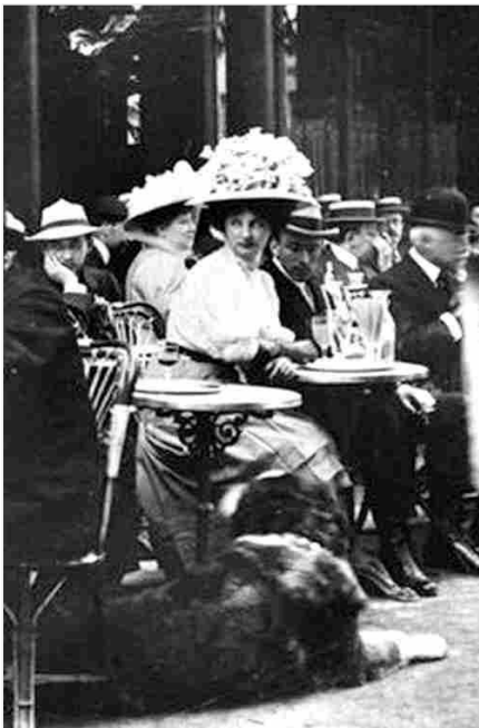
Figure 10 - Roger Viollet, Terrasse de café Paris (1925)