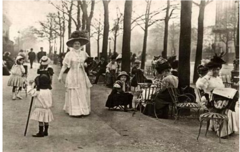
Figure 9 - Champs Elysées (1910)