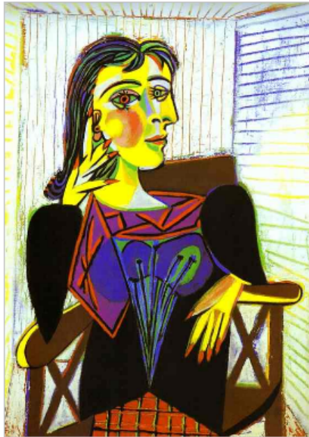
Picasso, portrait de Dora Maar