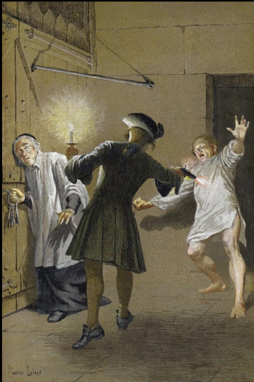
Illustration pour Manon Lescaut par Maurice Leloir « L'évasion » (1885)

Parcours : Personnages en marge, plaisirs du romanesque.