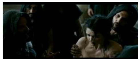
Et la dépouillent de ses vêtements