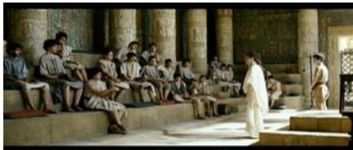
Une mère en charge de l'éducation

Sources antiques et instrumentalisation du personnage