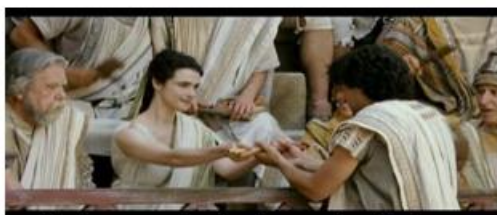
Musique et passion impuissantes face à la rigueur