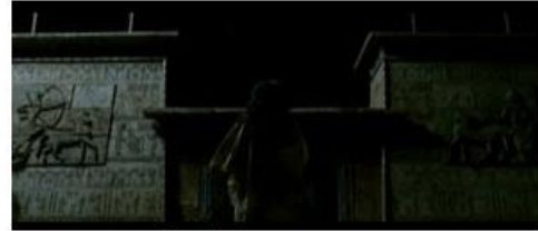
Et seule face aux astres

Sources antiques et instrumentalisation du personnage