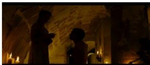
Une empathie maternelle décalée.