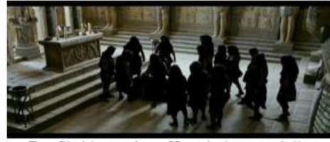
Des Chrétiens traînent Hypatie dans une église