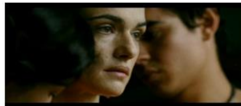
Un pur esprit qui méprise le corps