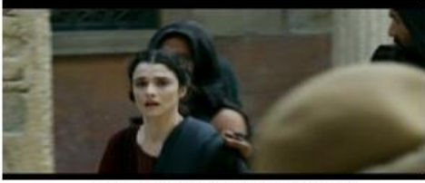
Arrestation d'Hypatie dans la rue