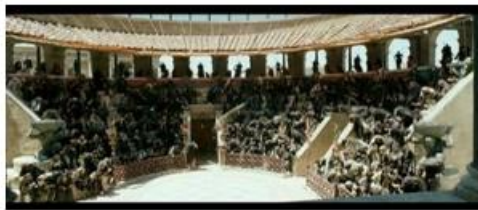
Violence des Chrétiens contre les Juifs