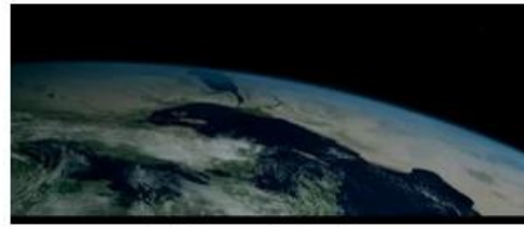
Après le sac du Sérapéum