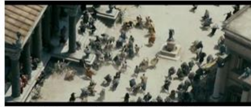
Violence collective des polythéistes