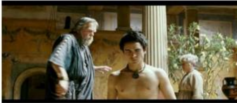
Violence domestique du sage platonicien