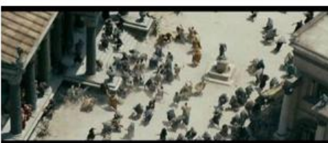
Les Polythéistes s'en prennent aux Chrétiens.