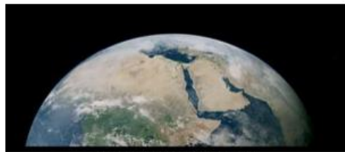
Après le meurtre d'Hypatie