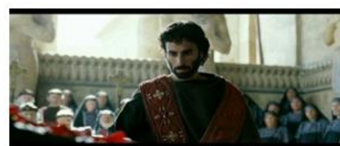
Cyrille, évêque d'Alexandrie