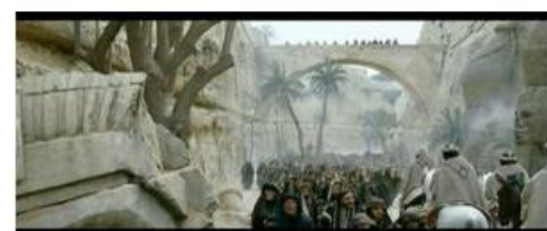
Synésios et son escorte parmi les Juifs