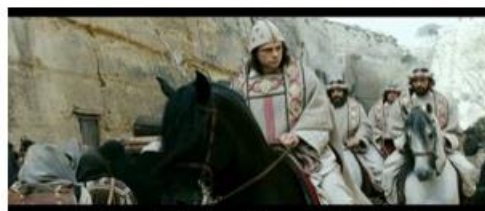
Synésios de Cyrène, évêque de Ptolémaïs