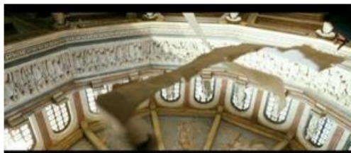
dans un renversement plein de papyrus