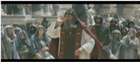
L'évêque attend vainement que les dieux anciens répondent aux insultes