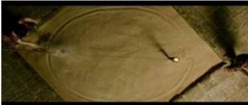
Découverte destinée à rester dans l'ombre