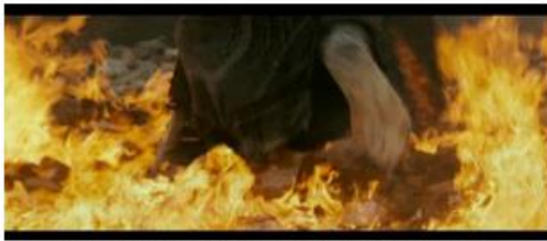
Ammonius traverse les flammes sans blessures