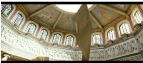
La caméra s'élève vers le ciel