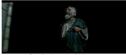
Première évocation d'Aristarque