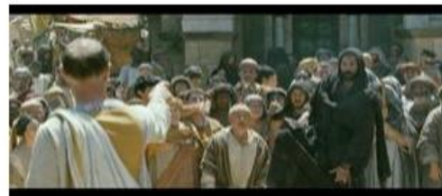
Joute verbale entre Ammonius et un polythéiste.