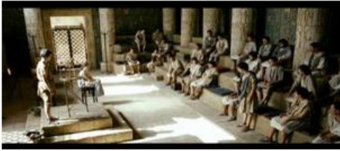
Les étudiants face au modèle de Ptolémée