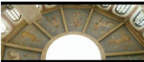
avant de redescendre vers le monde terrestre