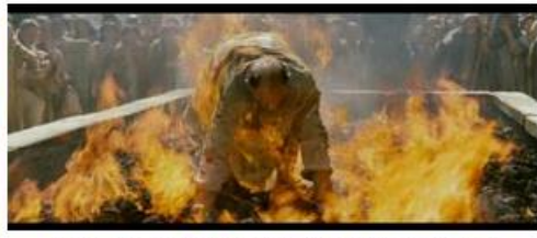
Les Chrétiens jettent le polythéiste dans le feu.