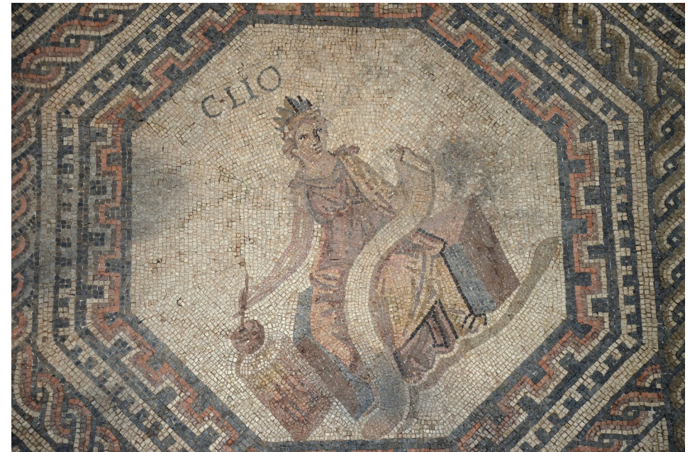
(détail de la mosaïque de Vichten, Musée national d'histoire et d'art du Luxembourg)

mercredi 20 mai 2026, Université Paris Nanterre