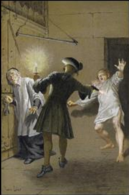
Illustration pour Manon Lescaut par Maurice Leloir « L'évasion » (1885)

Parcours : Personnages en marge, plaisirs du romanesque.