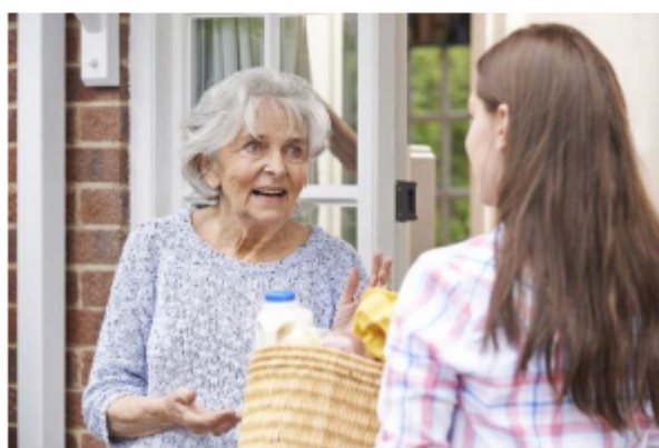
Lutter contre l'isolement des personnes âgées- Viva magazine

Bénévoles, voisins, associations et auxiliaires de vie œuvrent pour les soutenir et garder un lien social. Cela passe par différentes missions comme les courses. Des associations mettent aussi en place des appels téléphoniques gratuits qui permettent de remonter le moral des aînés et permettent aussi de suivre leur santé à distance. Ainsi, l'association la croix rouge française met en place une conciergerie solidaire nommée « Croix-Rouge chez vous ».