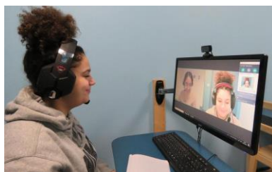
Exemple de cours en vidéoconférence.

Chaque enseignant à sa méthode pour assurer la continuité pédagogique des élèves. Certains envoient le travail à faire à la classe sur la plateforme de travail de leur choix, d'autres font des vidéos conférences pour chaque cours de l'emploi du temps habituel. Les exercices sont envoyés et notés afin que les enseignants puissent s'assurer du travail effectué par les élèves. Des évaluations à distance sont également adressées aux élèves qui ont un temps donné pour la renvoyer.