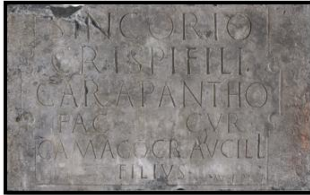
Stèle funéraire de Sincorius Carapanthus , II e siècle ap. J.-C., Bavay.