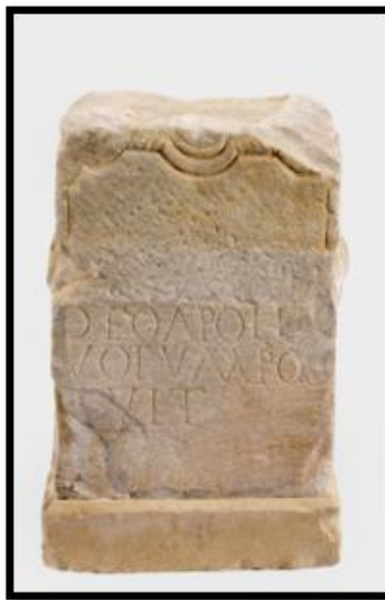
Autel votif, Ile s ap. J.-C., Labroquère.