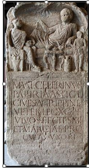
Stèle funéraire, Cologne, date incertaine.