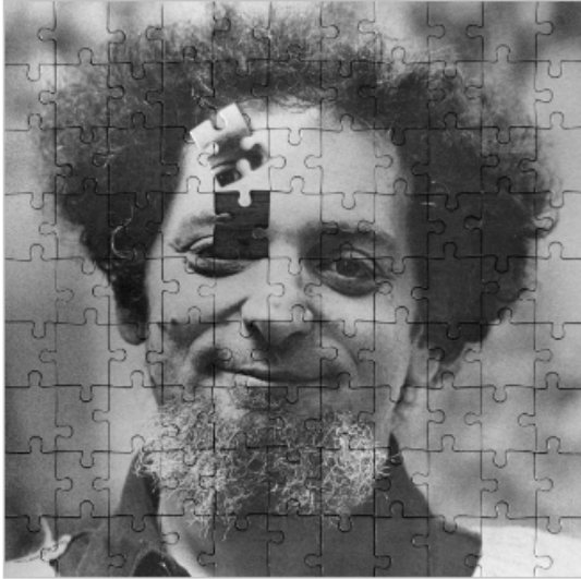
Portrait de l'écrivain Georges Perec

Ce sont des morceaux qui, assemblés, forment une image complète.